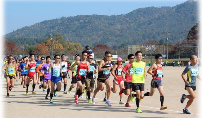
白竜湖グリーンマラソン実行委員会

11月恒例の白竜湖ふれあいグリーンマラソン大会 コロナウイルス感染拡大防止のため中止となります。