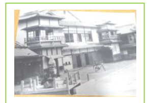
(両面地蔵・本郷会館)