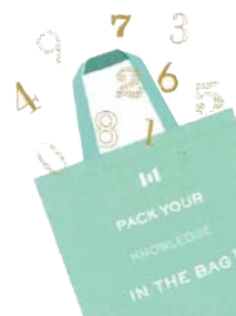
▲1階のグッズ販売コーナー