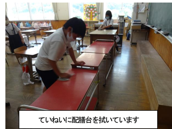
ていねいに配膳台を拭いています