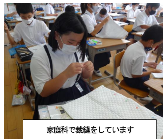
家庭科で裁縫をしています

ご家庭での朝の検温等にご協力くださり、ありがとうございます。家庭内での手洗い、うがいはできていますか。コロナ感染拡大予防と言い始めて、「習慣化したか」「だんだんいい加減になっている」に分かれてきているように思います。今一度検温と合わせて、手洗い、うがいを励行していきましょう。