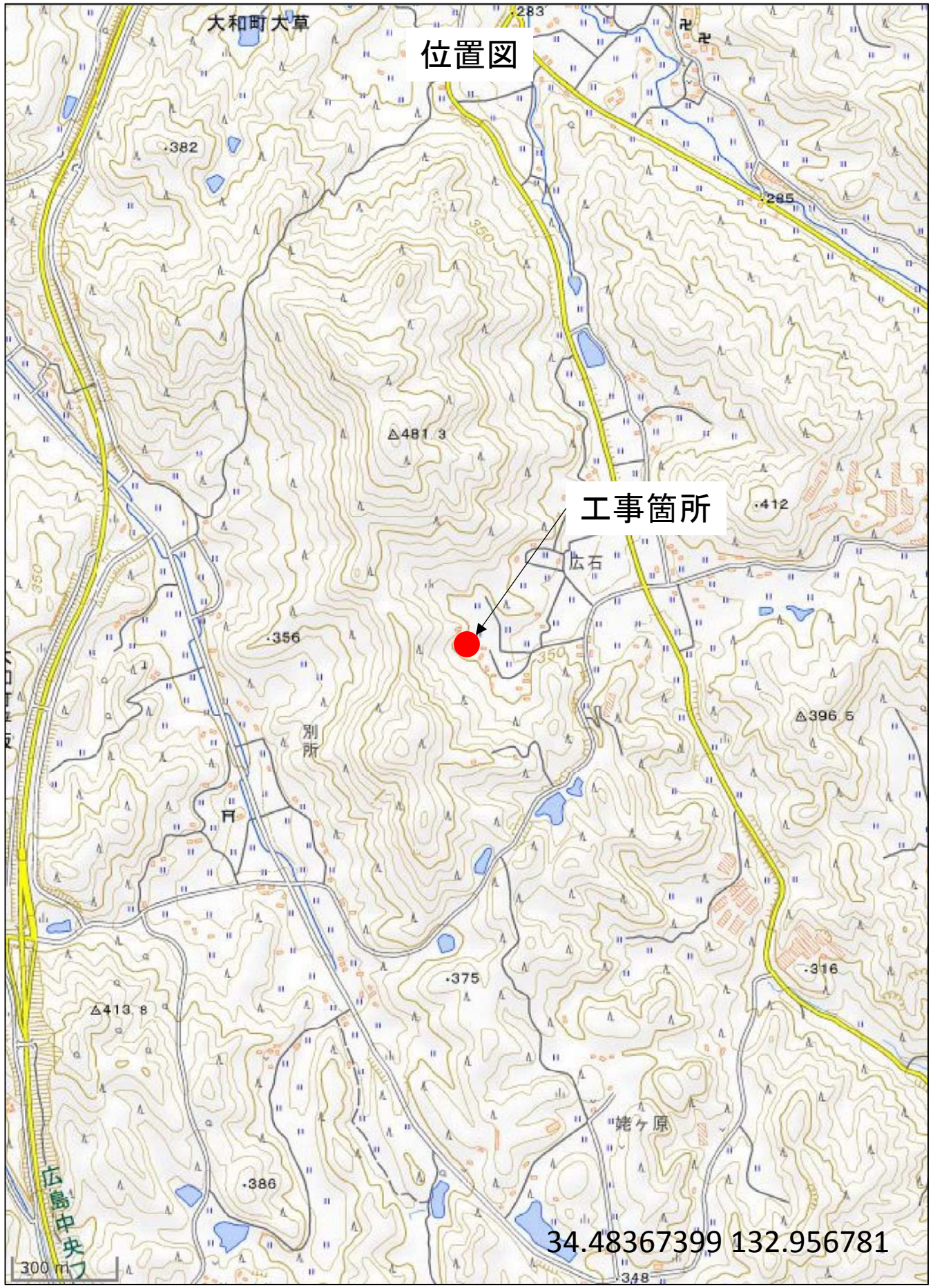
この図は、国土地理院地図を使用したものである。