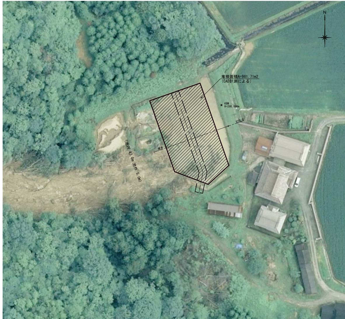
背景写真は国土地理院撮影の航空写真を使用