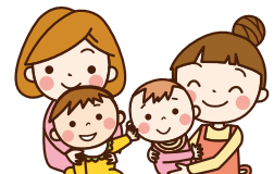
児童館移転後のイメージ