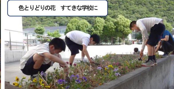
色とりどりの花 すてきな学校に