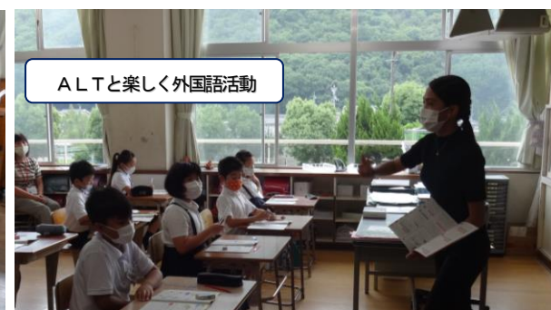
ALTと楽しく外国語活動