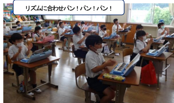
リズムに合わせパン!パン!パン!

また、学校からもできるだけ丁寧な連携を取らせていただくよう努めさせていただきます。保護者の皆様(特に1年生の保護者の皆様)におかれましては、何かと心配されておられると思います。気になることなど遠慮なく学校の方へご連絡、ご相談ください。