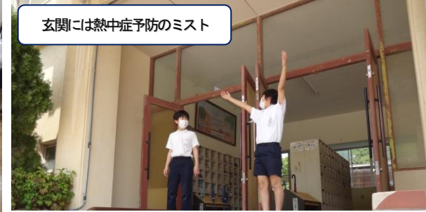
玄関には熱中症予防のミスト