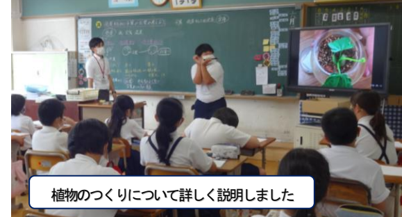
植物のつくりについて詳しく説明しました