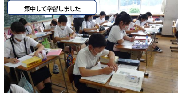
集中して学習しました