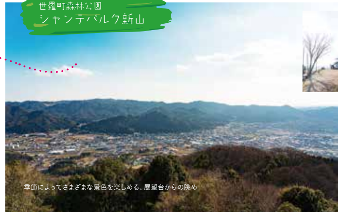
季節によってさまざまな景色を楽しめる、展望台からの眺め

自宅がありながら、マイカーを改装して車中泊し、あちこちへ足を延ばしている。つながりを求めて、さまざまなイベントに参加中。