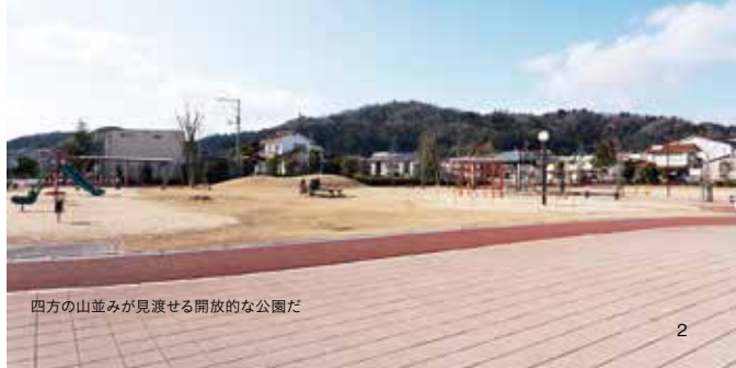
四方の山並みが見渡せる開放的な公園だ

「楽しい子育てを考える会」に所属。ベビーマッサージ教室を開催するなど、世羅町内で、さまざまな活動を行っている。