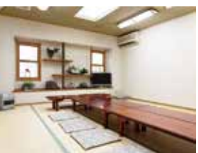
座数があるので、子ども連れにもうれしい!

「海老アーモンド揚げと世羅牛コロッケ」1100円(前菜、メイン、サラダ、ライス、スープ、デザート、コーヒー付き)