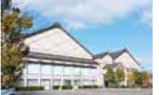
せら文化センターなど公共施設にも隣接

2014年10月にオープンした都市型公園。園内にはすべり台やジャングルジムなどの遊具のほか、芝生スペースもあるので小さな子どもから高齢者まで、幅広い世代の憩いの場になっている。商業施設や世羅図書館のあるせら文化センターに隣接。遊びに、学びに、ショッピングにと、公園を起点にゆつくり過ごすこともできる。屋外イベントの会場として使われることもあり、さまざまな催しを行うことができます。