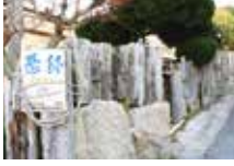
ゆっくりと島時間を満喫したい

まるでおばあちゃんの家に帰ってきたかのような安心感。島内外の人が出会う、ハブの役割も果たしています