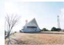
屋外ステージ前の広場で思い切り遊ぶこともできる

気軽に楽しめる キャンプ場 新山の頂上付近にある多目的施設。通年使えるキャンプサイトを中心とした野外活動コーナーと、屋外ステージや展望台が設けられている展望コーナーがある。展望台からは世羅町の町並みが一望でき、雲海や夜景のスポットとしても知られている。キャンプ場の利用は無料。世羅町役場に要予約。壮大な自然を気軽に楽しめる、穴場的スポットだ。頂上まで車で上がれるのも、家族連れにはうれしい。