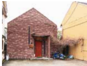
もともとギャラリーだったスペースが、レストランに生まれ変わった