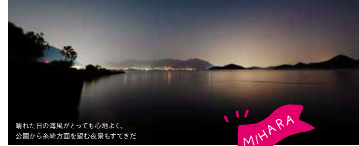
晴れた日の海風がとっても心地よく、公園から糸崎方面を望む夜景もすてきだ