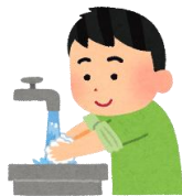
手洗い・手指消毒