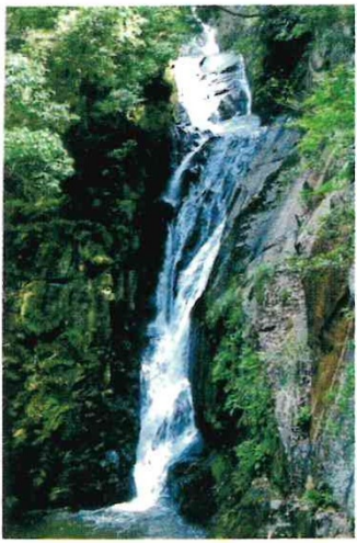
▶昇雲の滝(高坂町許山)