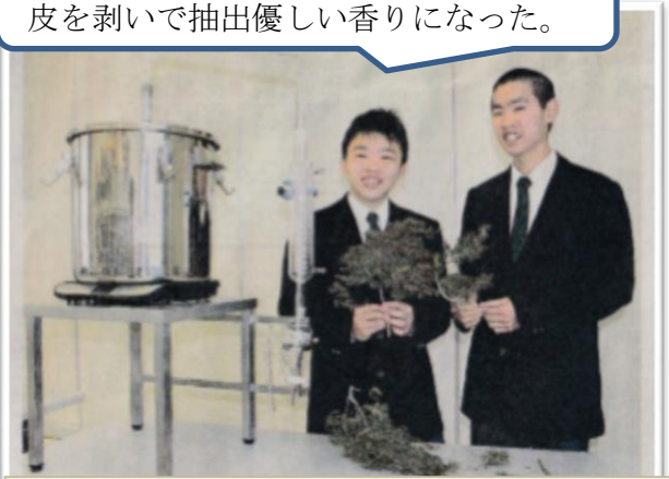
ネズの枝葉を手に、アロマ開発への思いを語る神垣さんと中尾さん