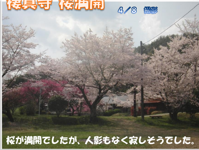
桜が満開でしたが、人影もなく寂しそうでした。