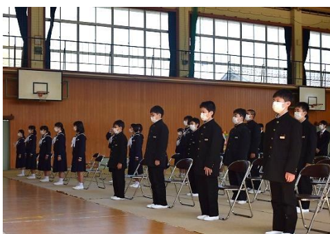
幸崎小学校：新入生 14名