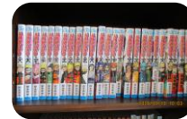
寄贈された漫画本