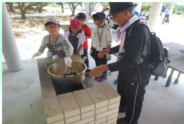
カレー作りは順調です。 いい匂いがしてきました・・・♪