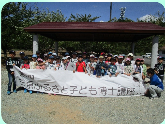
みんなよく頑張りました！