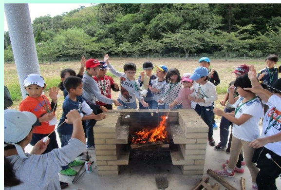
くんせいにしたチーズやちくわ、火であぶったマシュマロを食べました。