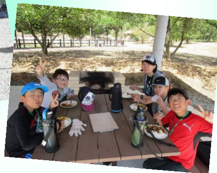
出来ました！！ みんなでそろっていただきます～☆