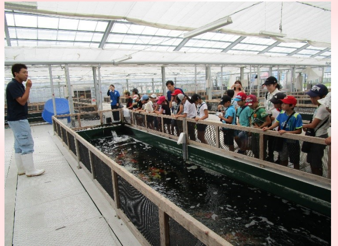
この水槽には大きくなった鯉がいます！