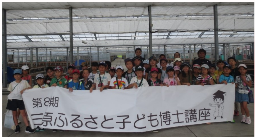
阪井養魚場のみなさんありがとうございました！