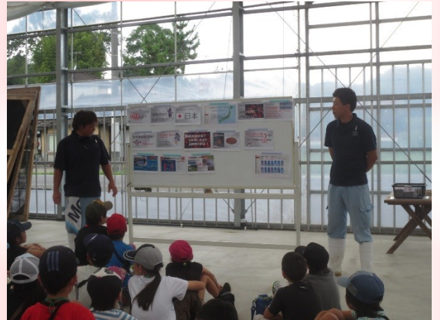
まずは阪井養魚場さんからの解説です！