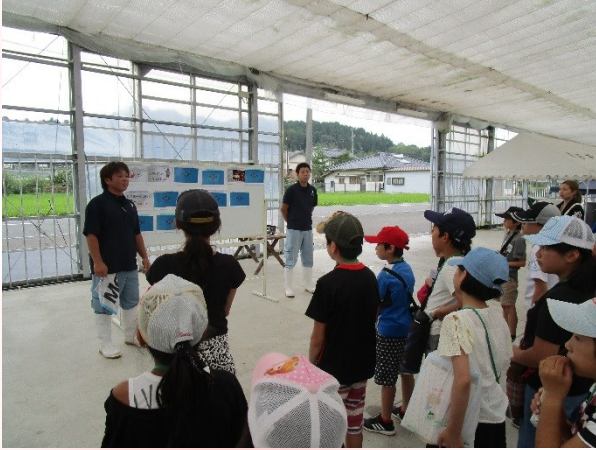
ここでは立派な錦鯉が見学できます。