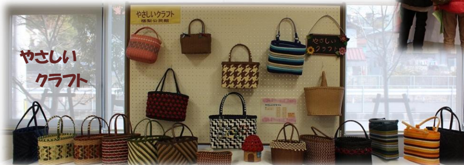
やさしいクラフト