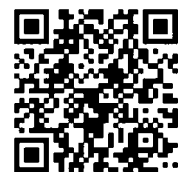
▲専用HPの2次元コード