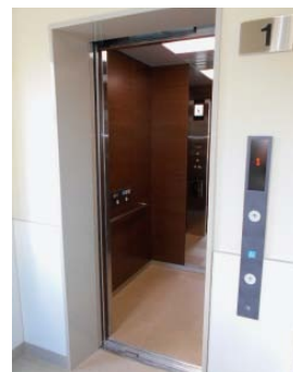
▲車いす対応のエレベーターを設置