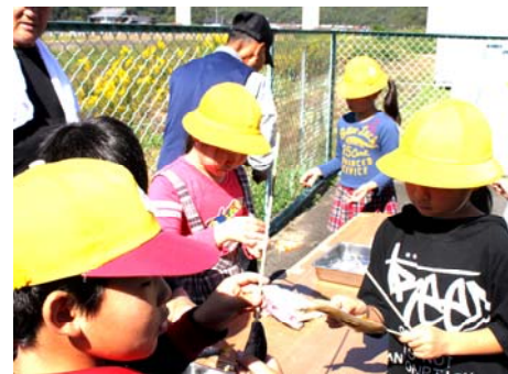
本郷沼田川漁協との交流会

10月14日、4年生が本郷沼田川漁協の皆様にご招待いただきました。4年生は、本郷沼田川漁協の皆様へ、あゆの稚魚の放流や沼田川の見学などで大変お世話になっております。子どもたちは、天然のあゆと養殖のあゆをくしにさして炭火で焼きました。焼くと、見た目もおいしさも違うことがはっきりと分かりました。