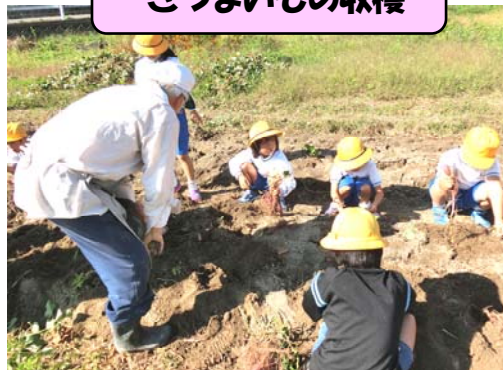
さつまいもの収穫

10月19日、1年生が亀齢会の方と一緒にさつまいもの収穫をしました。このいもは、5月29日に亀齢会の方と苗を植えたものです。子どもたちは、「わあ！おっきいのみつけた。」と歓声をあげてほっていました。このさつまいもは、11月6日(金)の「感謝の会」の時にご招待した地域の皆様と一緒に食べます。