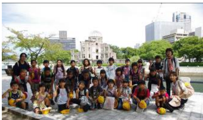
原爆ドームをバックに、船木小3・4年生で記念撮影

「峠三吉碑」、「原爆供養塔」、「韓国人原爆犠牲者慰霊碑」、などの碑めぐりもしました。