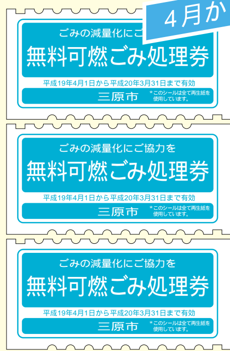
表1 シールの変更時期

4月から使用する無料可燃ごみ処理券(青色)を、21日(水)から3月末までに、送付します。年間配布枚数は、1月1日現在の住民基本台帳に記載されている世帯構成人数で計算します。 1月2日以降に、市外から転入、市内で新しく世帯をつくった人などは、届け出月の配布基準で後日送付します。 シールの変更時期は、表1のとおりです。まちがいなく配達するために、ポストに名前を記入するなど、ご協力をお願いします。