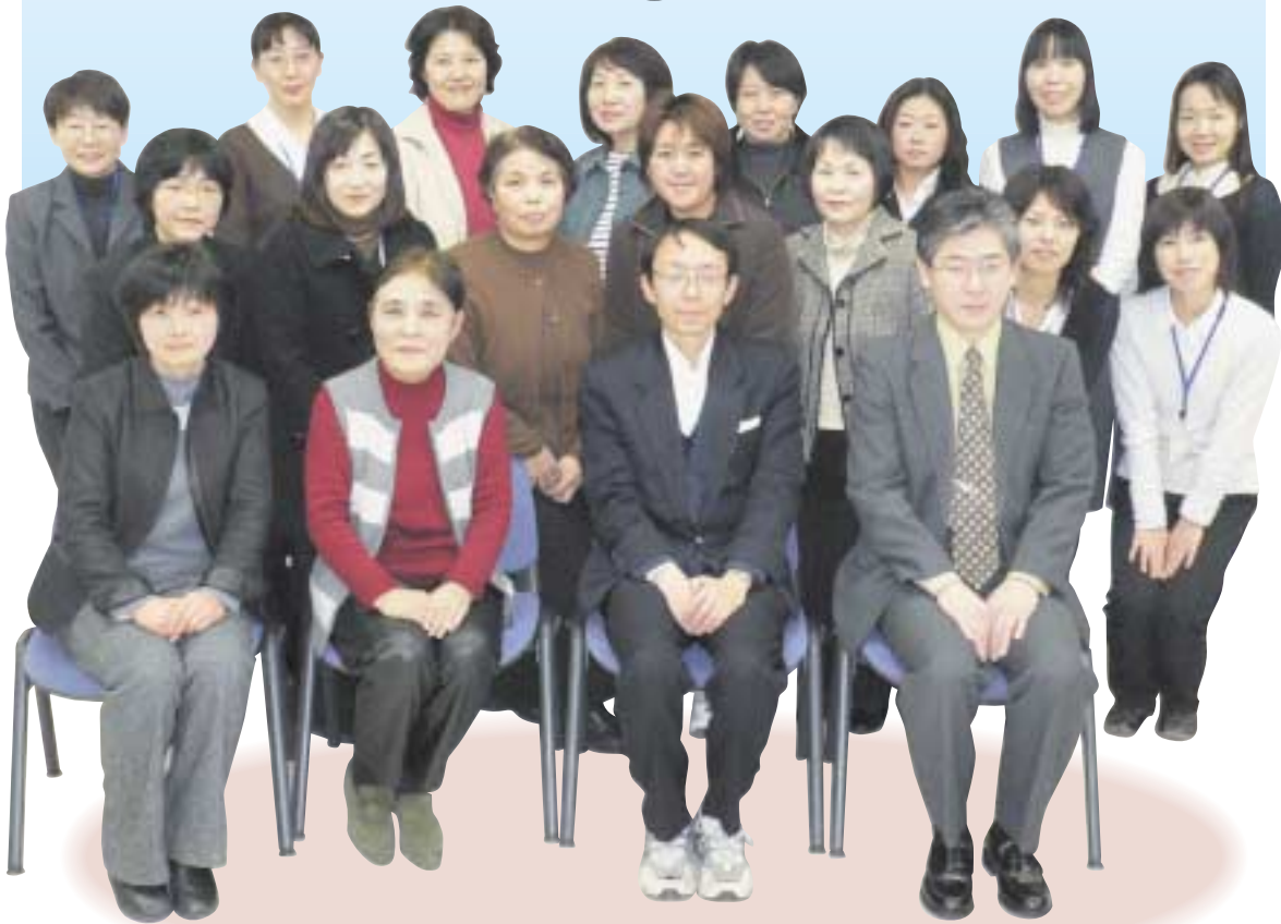
関係機関・団体、ボランティア、学校、行政などで構成している 「みはらだいすき」ネットワークの皆さん

最近、「朝ごはんを食べない、食べられない」という大人や子どもが増えています。1日のスタートである朝ごはんは、私たちの心とからだの健康や、生活リズムを作る上で、とても大切です。健康づくりの第一歩として朝ごはんについて考えてみましょう。