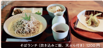
そばランチ(炊き込みご飯、天ぷら付き) 1200 円