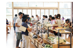
にぎわう産直市コーナー

世羅観光や産直市場、飲食店などを巡る拠点に、必ず立ち寄ってほしいのが道の駅世羅。パンフレット配布やチケット販売もあり、フードコーナー、産直市を併設する。フードメニューにはご当地グルメもあるので、気軽に利用して。せらインフォメーションカウンターに常駐する観光コンシェルジュに、旬の情報を聞いてから出発しよう。