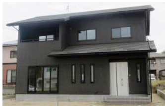
(株)佐藤工務店 ☎0848・46・0821