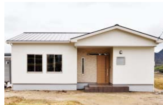
タカシン・ホーム ☎0848・61・1020