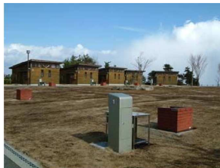
写真 棲真寺オートキャンプ場