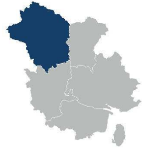
表 対象地区・対象小学校区（大和地域）

○全域が都市計画区域外で、地域生活拠点（大和町下徳良・和木地区）を中心とし、河川などの自然に恵まれた農村集落地域です。