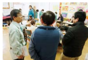
▲お試し就労のようす

お話し就労の後、事業所との面談などにより、フルタイムやパートタイムで採用される場合もあります。 とき 申し込み時に案内 ところ 表の協力事業所 内容 仕事の見学や体験 対象 30〜40代の子育て中の女性や55