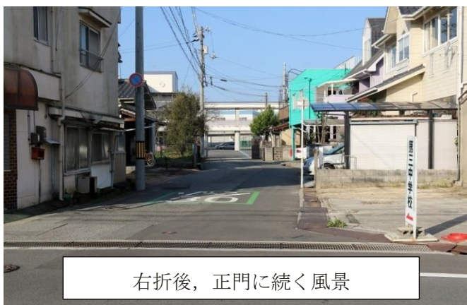
右折後、正門に続く風景