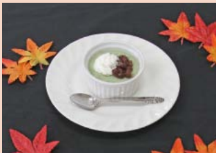
なめらか米粉プリン