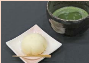
米粉deレモンみるくまんじゅう

内容 伝統芸能の披露(獅子太鼓)、記念映像の上映、式典、市立小学生による合唱、閉幕宣言