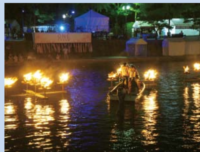
▲広島市で行われたかがり火のようす

小早川隆景をはじめとする歴代城主をしのび、築城500年への希望のともしびとして、三原城の堀にかがり火をともします。やさ踊りの披露やしの笛の演奏なども行います