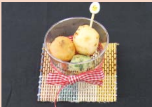
もっちり! 米粉ドーナツ☆