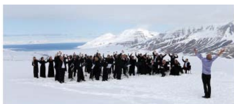
▲ノルウェー・アーケティック・フィルハーモニー管弦楽団