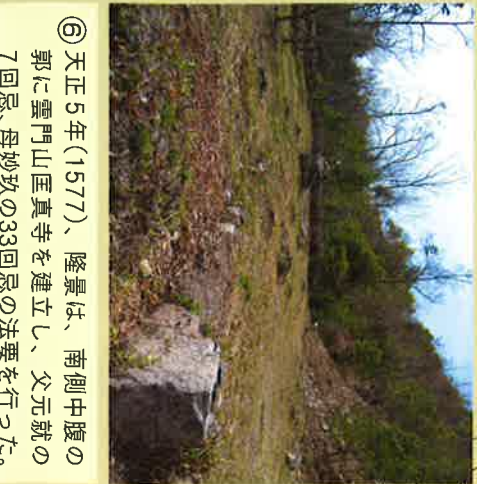
⑥ 天正5年(1577)、隆景は、南側中腹の郭に雲門山匠真寺を建立し、父元就の7回忌、母妙玖の33回忌の法要を行った。寺跡からは多量の瓦が出土している。