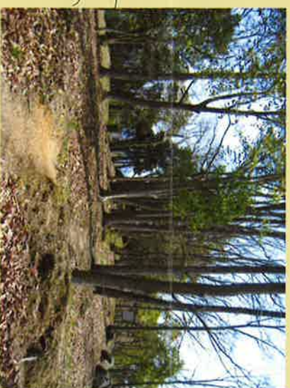
② 本丸跡には枡形の土塁や建物礎石等があり、永禄4年(1561)には毛利元就・隆元親子が10日間滞在し、隆景は、会所、表座敷、裏座敷、高間、常の茶の湯の間などの建物で、連日、能楽や連歌、太平記読みなどを催して饗応接待している。