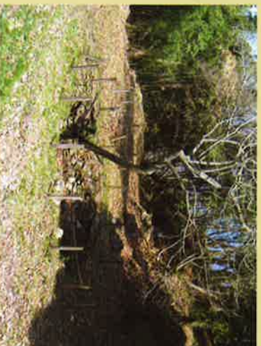
③ 山頂に近い釣井の段(井戸郭)には、立派な石積みの大井戸が6ヶ所あり、多勢の武将たちが山上生活をしていたことを物語っている。ヤマザクラ・ヤマツバキ・ツツジ等が咲く早春には、絶好のハイキングコースとなる。