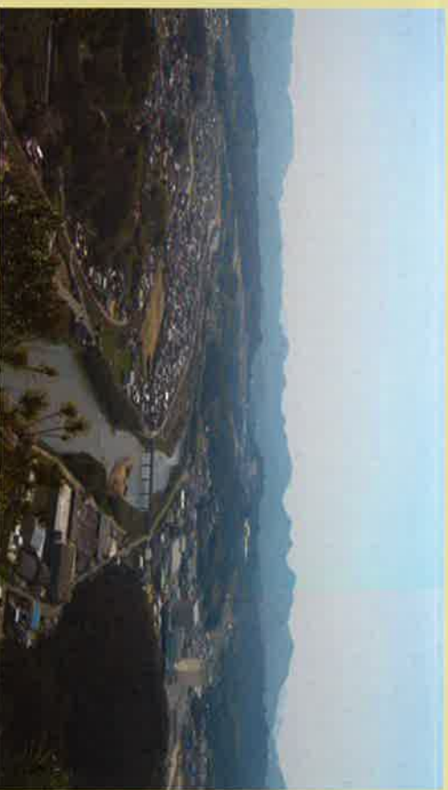
① 詰の丸跡に立つと、眼下に沼田川によってひらけた本郷の町や瀬戸内海が望める。