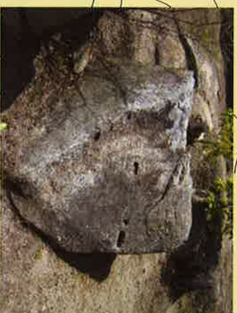
① 新高山は昔から巨石を多く産出していたらしく、山頂の詰の丸には石を切り出す矢穴跡の見える石が多い。