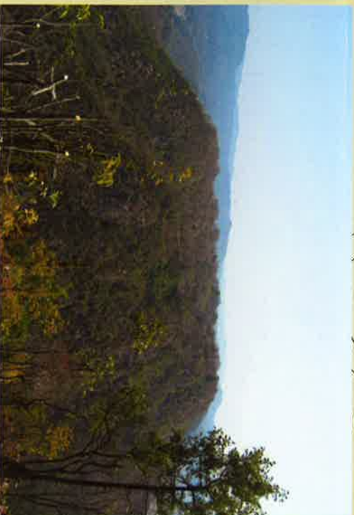
① 対岸の高山城跡は、土肥実平から4代目茂平の時代に築城され、17代隆景が新高山へ城替えをするまで約350年間沼田小早川氏の居城となった。