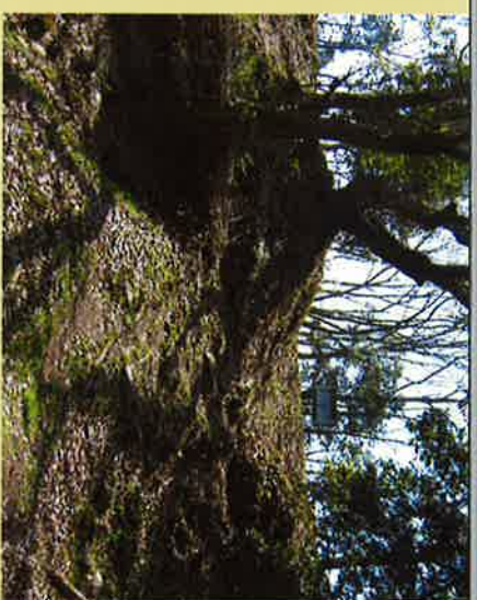
② 釣井の段側から本丸跡へと登りきったところには門があったとされる。