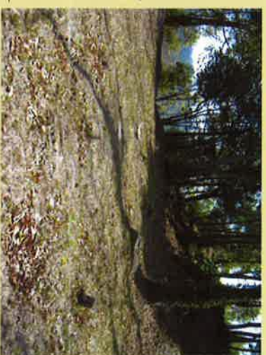
② 本丸跡に残る礎石。