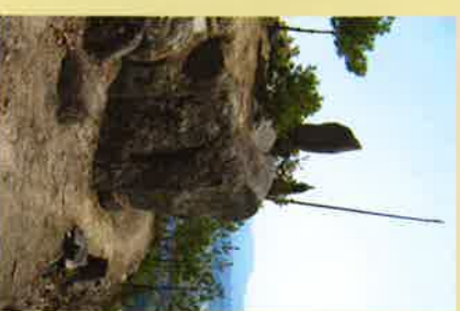
① 詰の丸跡にある石造物。