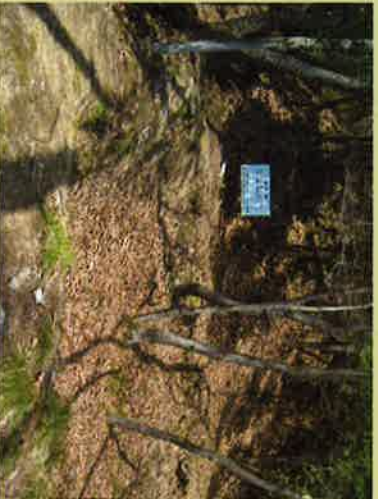
⑦ 番所跡は3段あり、土塁が今も残る。