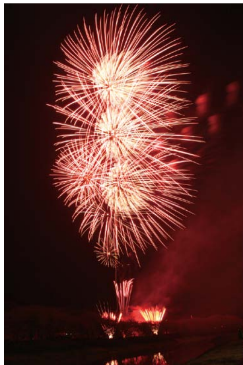
▲満開の夜桜と花火の共演が楽しめます