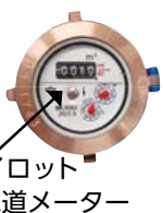
パイロット 水道メーター

全ての蛇口 を閉めた状態 で、水道メー ターのパイロ ットが回って いたら漏水です。発見したとき は、指定給水装置工事業者に 修理を依頼してください。