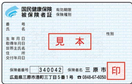
▲新しい保険証(見本)

今月1日から、国保の保険証が新しくなります。医療機関などを受診する場合は、必ず新しい保険証を提示してください。有効期限は来年9月末です。