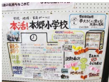
▲学校の特色ある取り組みの紹介