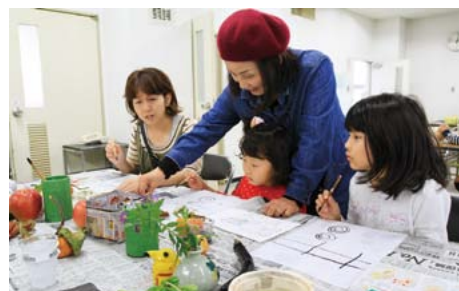
▲ふらり体験コーナー