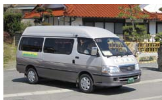
▲予約制乗り合いタクシー(写真は和地域で運行中のもの)