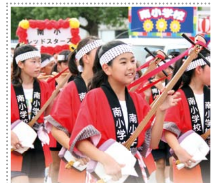
16時~ 子どもやっさ踊り 18時~ 正調やっさ踊り