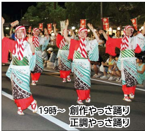
19時~ 創作やっさ踊り 正調やっさ踊り

2015ゆるキャラグランプリ優勝 浜松市マスコットキャラクター 出世大名家康くん ほか