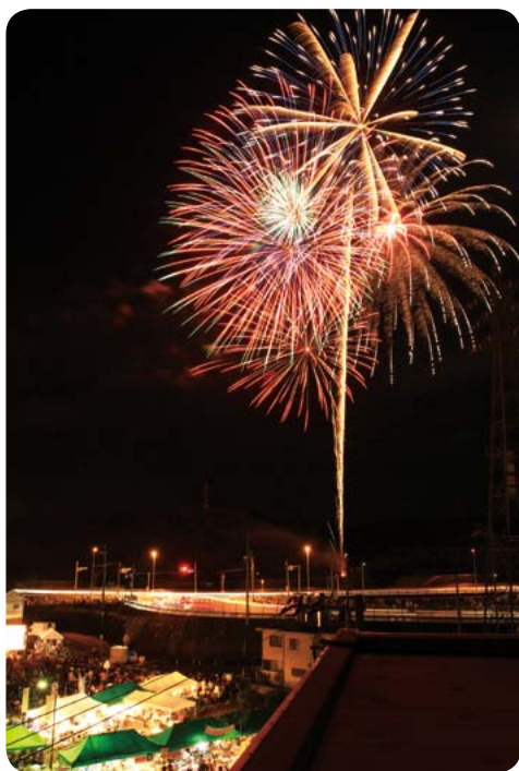
▲夜空に打ち上がる花火とメイン会場

ところ 本郷支所周辺 内容 天保の大飢饉で亡くなった人を弔うために始まった「二十三夜祭」から続く夏祭り