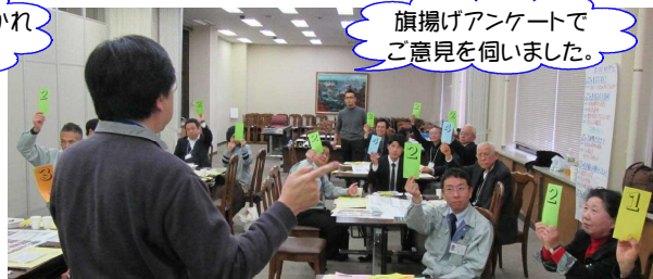
旗揚げアンケートで ご意見を伺いました。