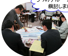
5つのグループに分かれ 検討しました。