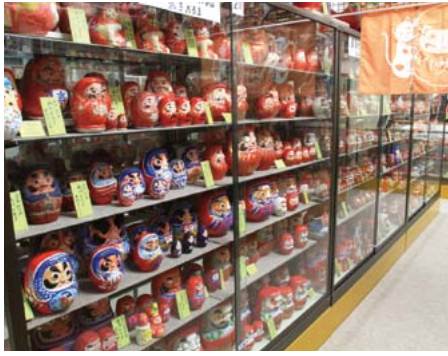
▲極楽寺の達磨記念堂