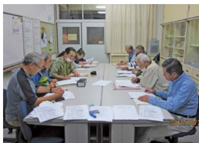
▲“祭り”という目標に向かい、住民が一弾となっています

者名②住所・電話番号③撮影日④撮影場所⑤作品名を総務広報課(〒723-8601港町三丁目5番1号 ☎0848-67-6007 somukoho@city.mihara.hiroshima.jp)へ