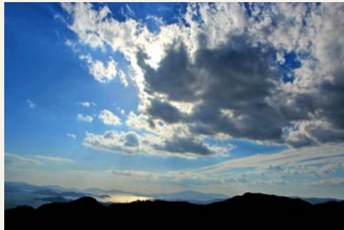
秋の流れる雲 撮影日 平成27年10月 撮影場所 白滝山