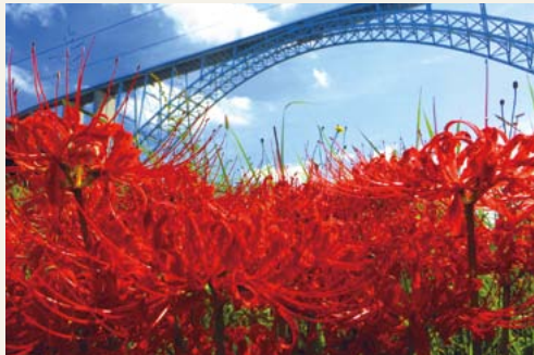
曼珠沙華 撮影者 中原静恵さん 撮影日 平成27年9月 撮影場所 本郷町船木