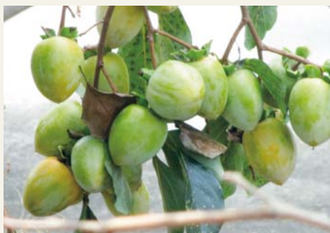
早く美味しくなれ 撮影日 平成27年9月 撮影場所 久井町坂井原