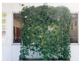
▲優秀賞 神田公民館