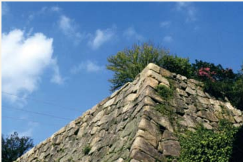
天を仰ぐ 撮影日 平成27年10月 撮影場所 三原城跡