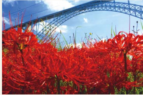
曼珠沙華 撮影日 平成27年9月 撮影場所 本郷町船木