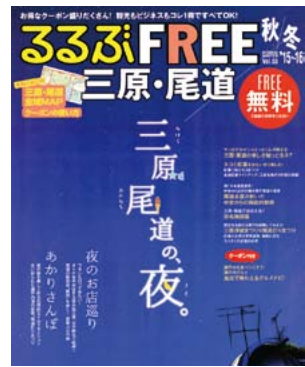
▲夜楽しめる店や場所を特集したるるぶFREE三原・尾道第3号

市は無料の観光情報誌「るるぶFREE三原・尾道15・16秋冬号」の配布を始めました。県内を中心に、中国・関西地方の一部サービスエリア、中国地方の道の駅などで配布し、市の情報発信と観光客の誘致を図ります。