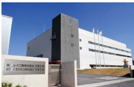
▲高砂香料工業の三原工場では食品香料が生産される