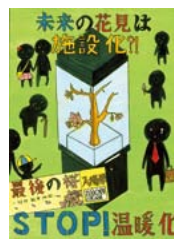
▲「未来の花見がこうなる前に……」 向井周音 (広大附属三原中)