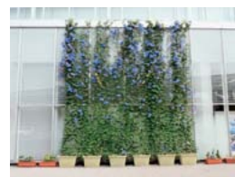
▲優秀賞 芸術文化センター ポポロ