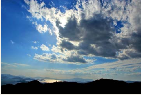
秋の流れる雲 撮影日 平成27年10月 撮影場所 白滝山