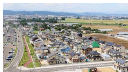
▲集団移転による新たに誕生した美田園地区の団地

域の生産拠点で、食品香料（フレーバー）の主力拠点として、安定した供給体制を維持する上で重要な役割を担います。