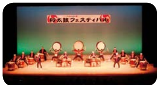
▲県立湯来南高等学校 和太鼓部(アトラク ション出演予定)