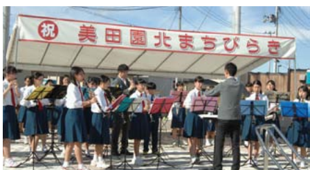
▲まち開きを祝う式典のようす

先月4日、職員が派遣先で従事している同市下増田地区から美田園北地区への約160戸の集団移転が概ね完了し、まち開きが盛大に行なわれました。地元中学生による吹奏楽演奏、マグロ刺身のふるまいなどが行なわれ、約300人の住民などが新しいまちの門出を祝いました。