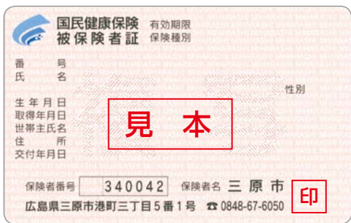
▲新しい保険証(見本)

今月1日から、国保の保険証が新しくなります。医療機関などで受診する場合は、必ず新しい保険証を提示してください。有効期限は来年9月30日です。