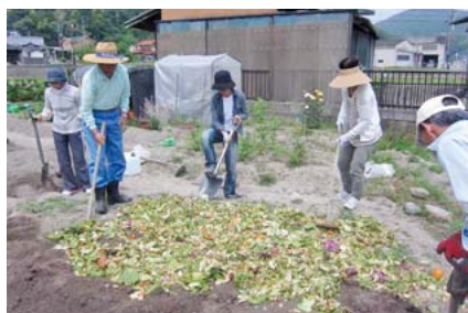
▲生ごみからの堆肥作りなど、各種講座で環境負荷の少ない生活と呼び掛けます

者名②住所・電話番号③撮影日④撮影場所⑤作品名を総務広報課(〒723-8601港町三丁目5番1号 ☎0848-67-6007 ㊚ somukoho@city.mihara.hiroshima.jp)へ