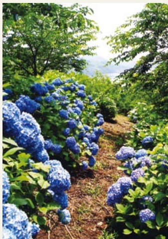
佐木島のアジサイ 日 平成27年6月 所 鷲浦町須ノ上