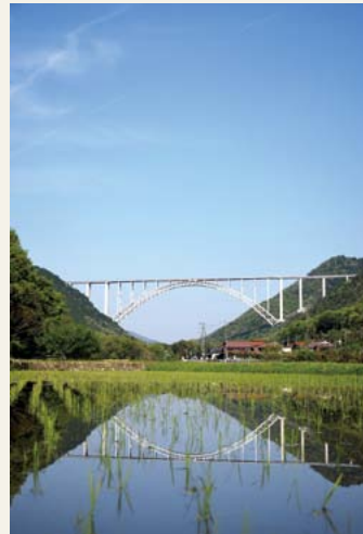
逆さアーチ 日 平成27年4月 所 本郷町船木