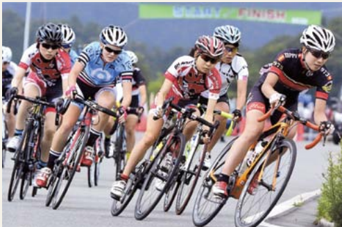
美しきアスリート達 日 平成27年7月 所 中央森林公園(本郷町上北方)