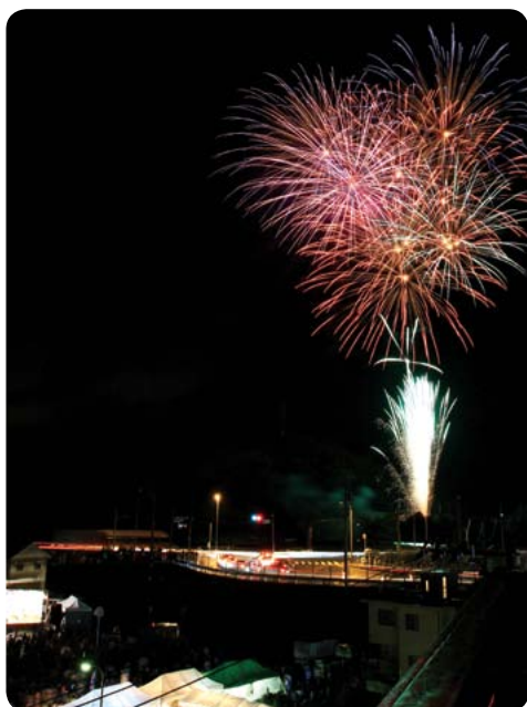
▲夜空に打ち上がる花火とメイン会場