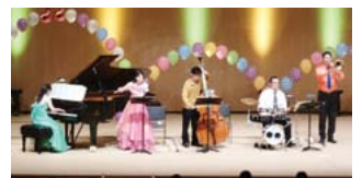
▲ゾリステン・ドライエック