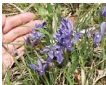
▲エヒメアヤメの花

朝鮮半島から中国大陸を中心に分布し、国内の自生地はその南限に当たります。繁殖での移動能力が低いため、国内に分布していることはかつて日本列島が朝鮮半島と陸続きであったことを植物学的に示す証拠となっています。