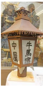
▲牛馬市にきた人が泊まる宿の軒先にあった灯り

牛馬市 牛馬市があった場所は、どうなっているんですか？ 牛馬市 現在は、久井歴史民俗資料館が建っており、当時のポスターや帳簿など、牛馬市の資料が展示されているんじゃよ。資料館の近くには記念碑もあるんじゃ。