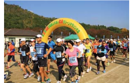
▲爽やかな秋空の下、たくさんのランナーが参加した昨年大会

申し込み 9月12日(金)までに、申込書(提出先、市内体育施設に用意)を白竜湖ふれあいグリーンマラソン大会実行委員会事務局(スポーツ振興課内 ☎0848・64・7219 ☎0848・67・5912)へ