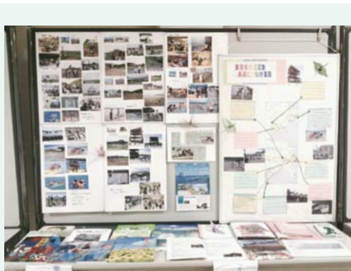
▲被災地訪問時のパネルを展示

平成26年度市民提案型協働事業 ほんごう子ども図書館 「平和のおはなし会」東日本 大震災を忘れない」