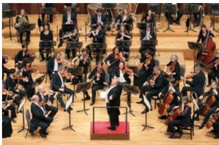
▲ベルリン交響楽団

入場券販売場所 ポポロ、ポポロオンライン、うきしろロビー、フジグラン三原、ワタナベ楽器 ほか