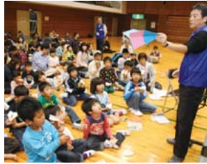
▲ギネス記録保持者が指導します