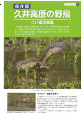
▲久井の野鳥を紹介