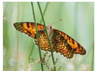
▲ヒョウモンモドキ

④性別⑤電話番号をくい文化センター(〒722-1412久井町和草1883番地6☎0847・32・7138FAX0847・32・8406)へ