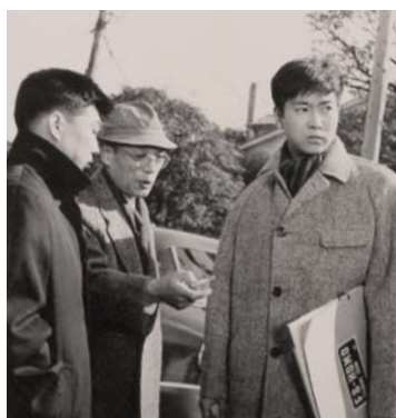
▲「陽のあたる坂道」の撮影風景