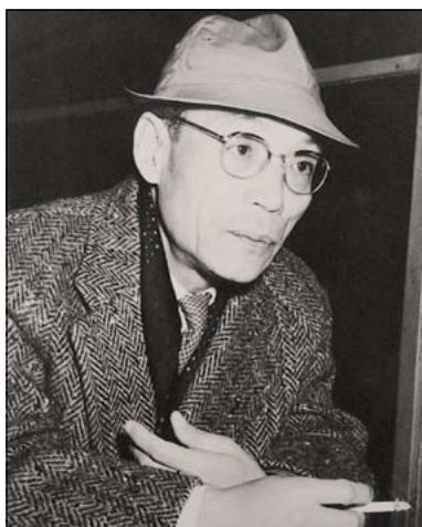
たさか ともたか 田坂 具隆

明治35年(1902年)現在の三原市沼田東町に生まれる。5歳の時に母を亡くし、父の住む京都に移り住む。旧制高校を中退後、新聞記者を経て、大正13年日活大將軍撮影所に助監督として入社。2年後に「かぼちゃ騒動記」を初監督する。昭和13年の「五人の斥候兵」はベネチア映画祭大衆文化大臣賞を受賞し、日本映画では初の海外国際映画祭受賞作品となる。終戦までに「爆音」「土と兵隊」など数多くの作品を手掛けた。