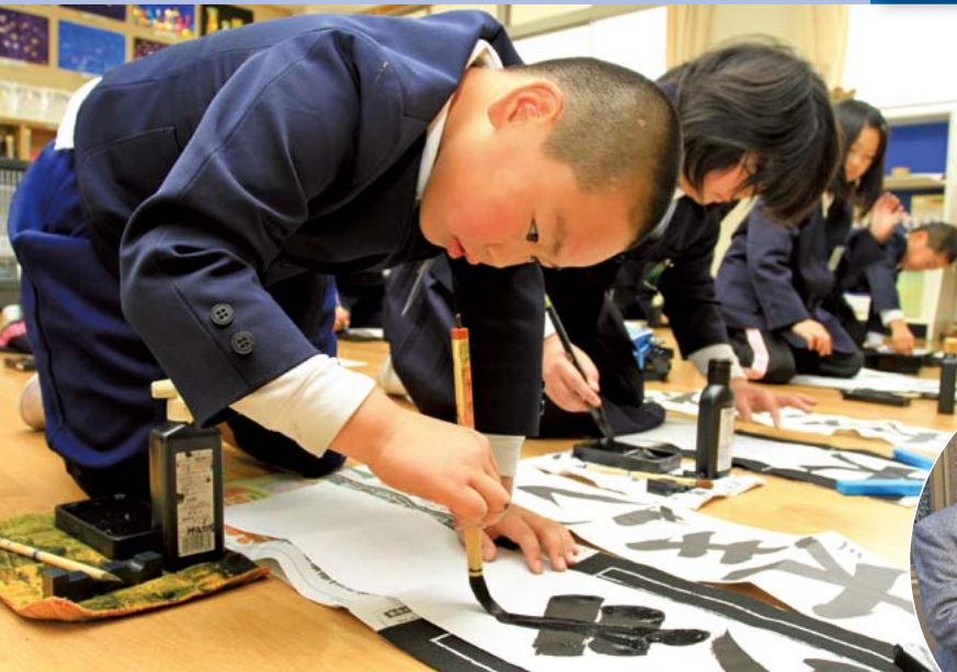
▲新しい年を迎え、全校児童が心豊かに筆をとりました (1/8 書き初め大会 大和小学校)