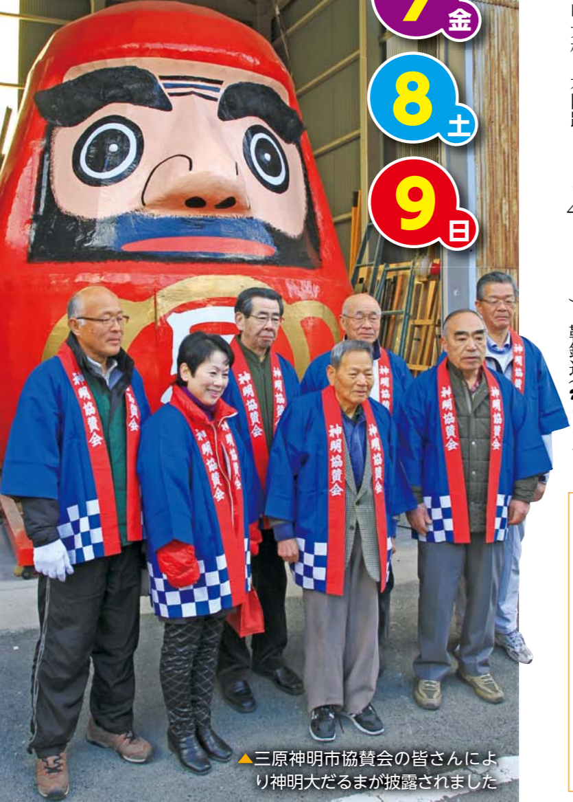
▲三原神明市協賛会の皆さんにより神明大だるまが披露されました

だるま面相書体験 とき 8日(土)・9日(日) 10時～15時 ところ うきしろロビー(ＪＲ三原駅構内) 定員 各50人(先着順) 参加費 500円 問い合わせ先 三原観光協会(☎0848・63・1481)