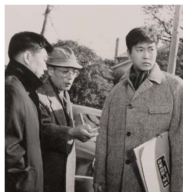
▲「陽のあたる坂道」の撮影風景