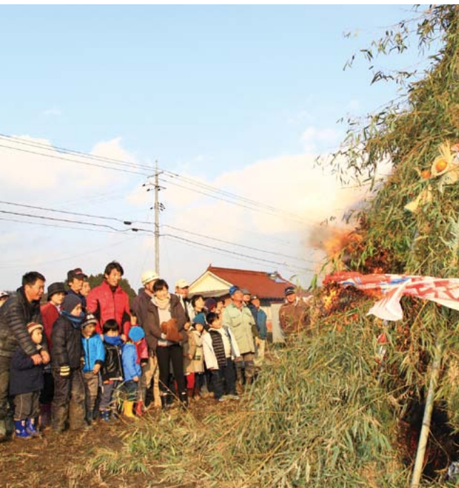
▲この一年の無病息災や豊作への願いを込め、空高く燃え上がる とんどを見守りました(1/12 とんどまつり 久井町羽倉)