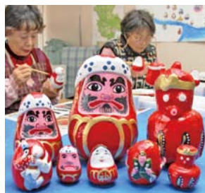
▲手作りの三原だるまも販売されます

は、江戸時代に売られるようになって、家族の数だけ買っと、家族の安全と繁栄、願いが叶うといわれているんじゃないよ。