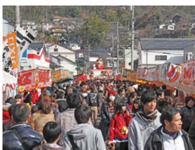
▲東町・館町・本町一帯で行われ、毎年多くの人出でにぎわいます