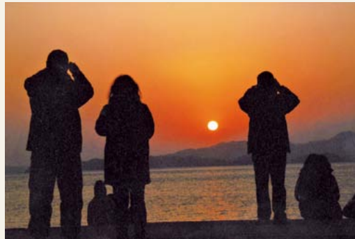
新年の日の出 撮影日 平成26年1月 撮影場所 円一町一丁目