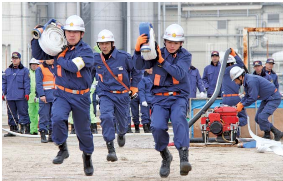
▲消防団30分団が速さと正確性で放水技術を競い合いました。小泉分団が優勝しました(1/12 消防出初め式 本郷総合公園)