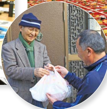
市内24の町内会などが心のこもったおせち料理を届けました(12/30 お正月を一人で過ごされる高齢者におせち料理を届ける活動 中之町コミュニティセンター)