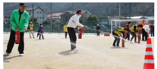
▲昨年の体験会のようなす

内 容 講演「南海トラフ巨大地震ー今すべき備えー」、消 火訓練、各種 展示、炊き出 し体験など ※親子で参加で きます。