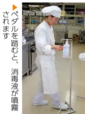
ペダルを踏むと、消毒液が噴霧されます。

者②住所・電話番号③撮影日④撮影場所⑤作品名を秘書広報課(〒723-8601港町三丁目5番1号 ☎0848-67-6007 hishokoho@city.mihara.hiroshima.jp )へ