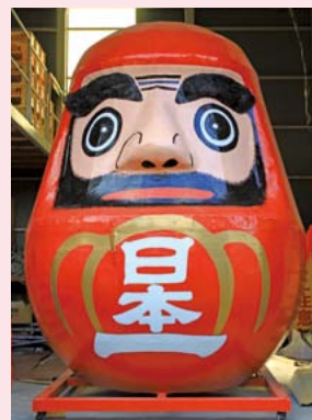
▲東町の倉庫で出番を待つ大だるま