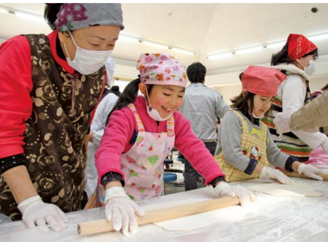
▲地域の人と一緒に小麦粉を丸めて、踏んで、伸ばして、切って、うどん作りに挑戦(1/11 手打ちうどんづくりの会 南方小学校)