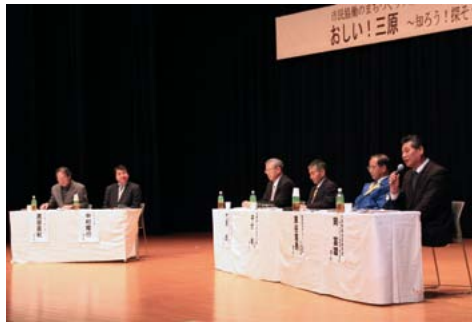
▲さらなる協働の推進に向けて、活発に意見が交わされました

市は先月11日、「おいしい！三原くろう！探そう！まちの魅力」をテーマに、市民協働のまちづくりフォーラムを開催しました。約170人が来場し、どうすればもっと地域を元気にできるのか、活動団体の発表をもとに登壇者と会場参加者との間で、活発な意見交換が行われました。