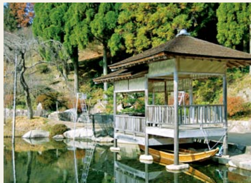
小春日和 撮影日 平成25年12月 撮影場所 三景園(本郷町善入寺)