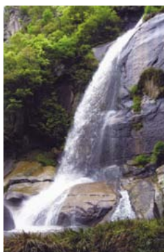
▶瀑雪の滝(本郷町船木)