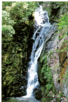
昇雲の滝(高坂町許山)

昇雲の滝(高坂町許山) 昇雲の滝じゃの。この滝の高さは51メートルもあって、市内の滝で一番高く、