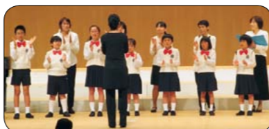
▲三原少年少女合唱団