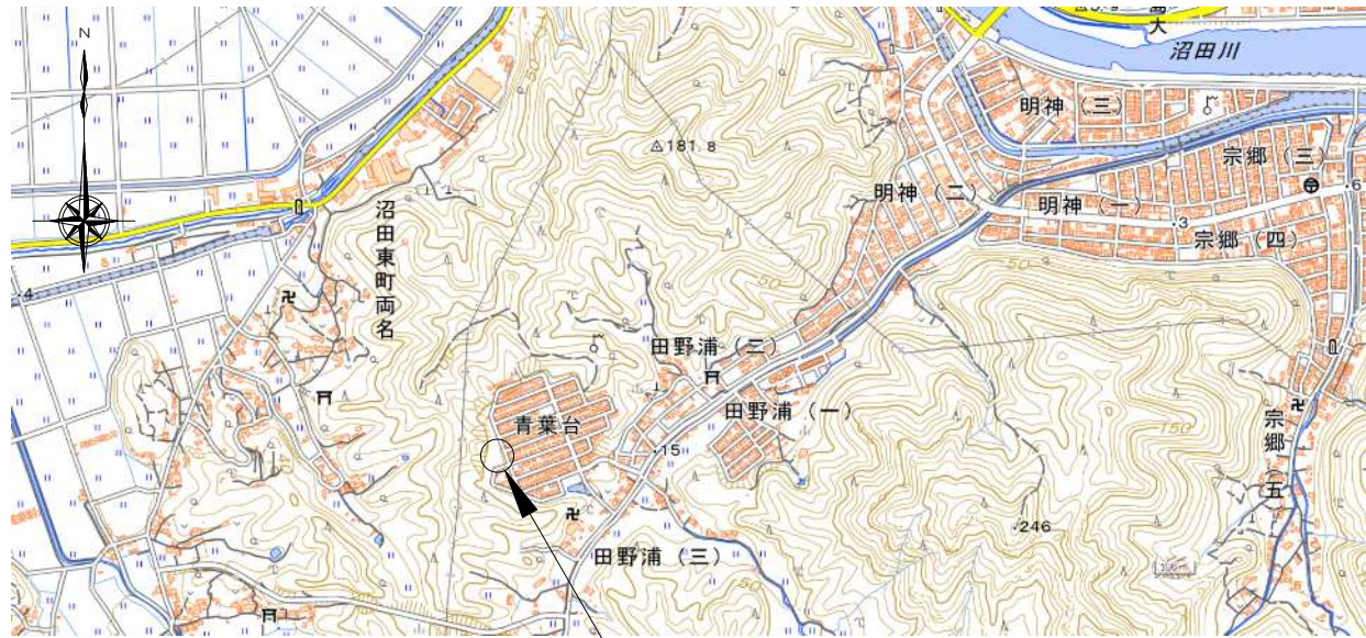
青葉台第三公園 建物所在地 ：三原市青葉台13番