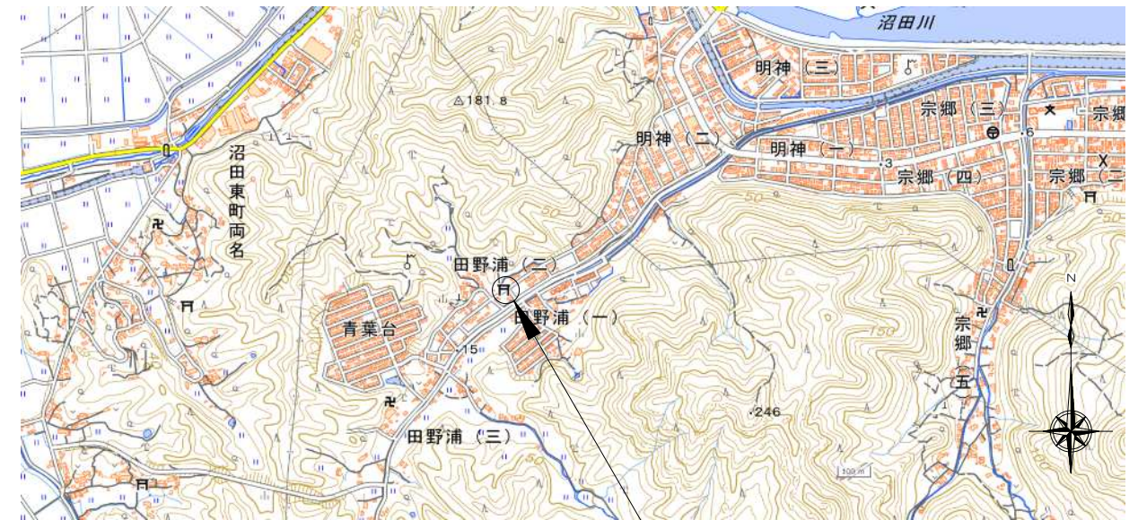
田野浦第一公園 建物所在地 ：三原市田野浦二丁目11番